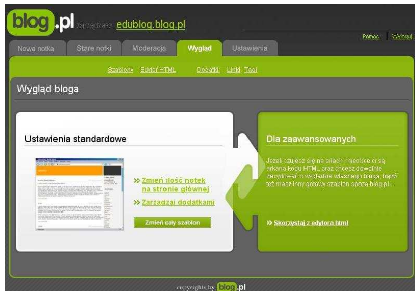
Rysunek 9. Wygląd bloga.

Dodatkami w serwisie blog.pl są linki oraz Tagi notatek. Linki są to odnośniki do stron, które autor bloga poleca czytelnikom. Tworzenie linku przebiega poprzez wciśnięcie przycisku nowy link, podanie nazwy linku (nazwa, jaka będzie wyświetlana na blogu), adres strony www (adres, na który zostanie przekierowany czytelnik po kliknięciu na link). Linki widoczne są na marginesie blogu (domyślnie) użytkownik może dowolnie wybrać miejsce ich prezentacji.