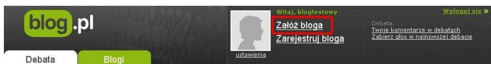
Rysunek 3. Zakładanie bloga.

Należy wybrać nazwę bloga, będzie to adres, pod którym zaistnieje nasz blog w sieci.