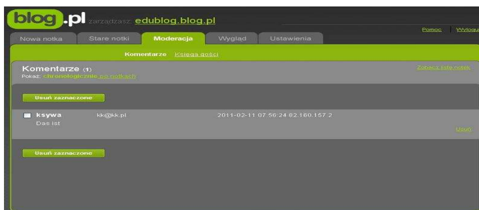
Rysunek 8. Zakładka moderacja.

Zakładka MODERACJA umożliwia zarządzanie komentarzami oraz wpisami w księdze gości. Komentarze są to wpisy czytelników odnoszące się bezpośrednio do notatek opublikowanych przez autora bloga. Księga gości jest to przestrzeń na blogu, w której odwiedzający mogą zostawić ślad po sobie w formie wpisu, pozdrowień uwag do autora bloga. Autor bloga ma możliwość usunięcia niechcianych komentarzy lub wpisów w księdze gości.