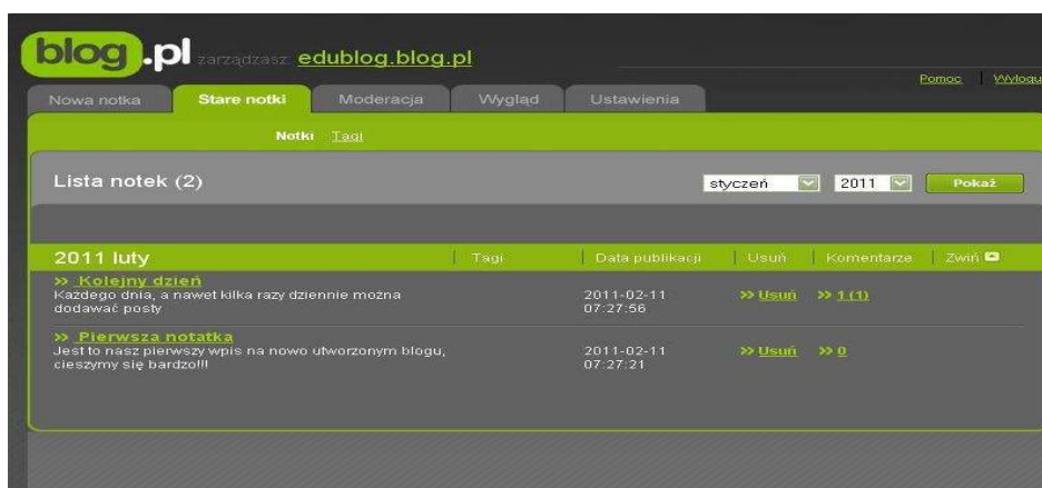
Rysunek 7. Stare notki.