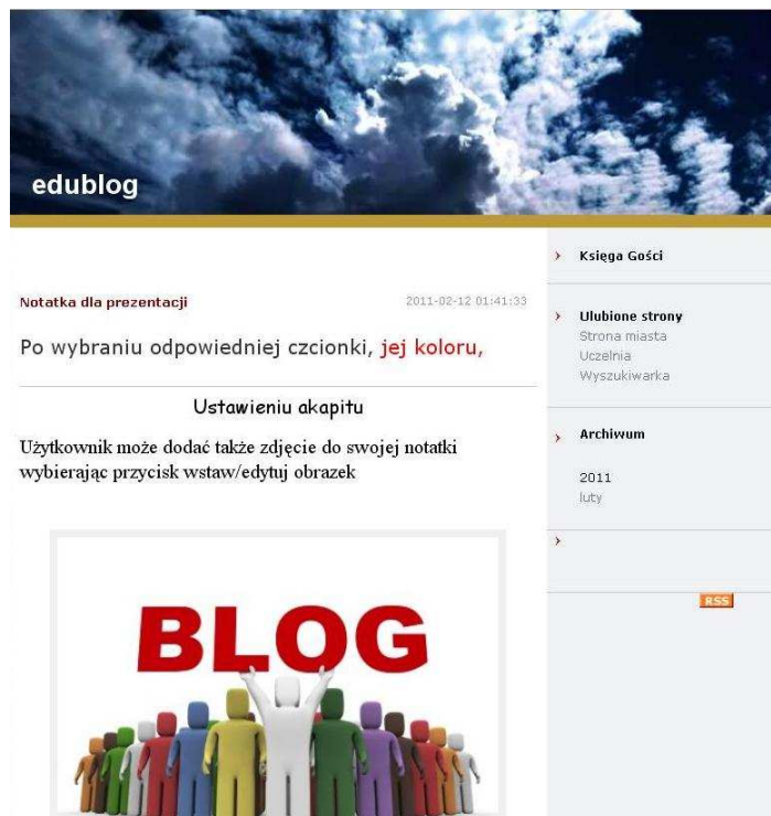
Rysunek 12. Podgląd bloga.

statystyki odwiedzin. Edytując szablon autor może dokonać zmian tła szablonu, dodawać nowe czcionki i wiele innych ciekawych rozwiązań, jakie daje znajomość języka html.