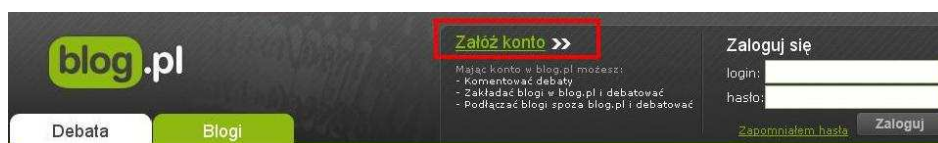
Rysunek 1. Zakładanie konta.

Po „kliknięciu” we wskazany odnośnik użytkownik przystępuje do zakładania konta w portalu poprzez podanie danych użytkownika.