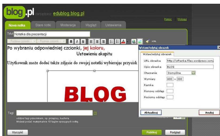
Rysunek 11. Nowa notka wraz ze zdjęciem.

Rysunek 11 przedstawia edytor dodawania nowych notek, została ustawiona czcionka, następnie zmieniony jej kolor, zmiana ustawienia akapitu na wyrównanie do środka, kolejna zmiana czcionki, dodanie obrazka znalezionego w Internecie do bloga.