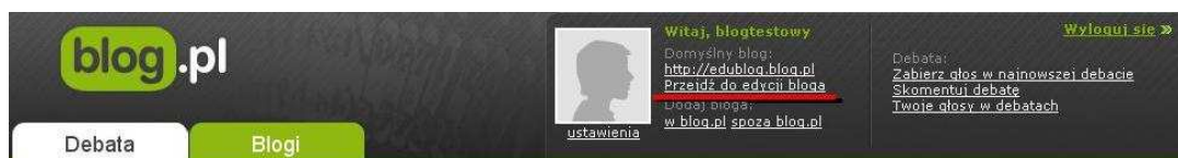
Rysunek 5. Przejście do edycji bloga.

Edytor bloga posiada kilka zakładek opisanych w sposób bardzo przejrzysty, służą one tworzeniu nowych wpisów, zarządzanie starymi notatkami, moderacja komentarzy/księgi gości, edycji wyglądu czy zmianie ustawień.