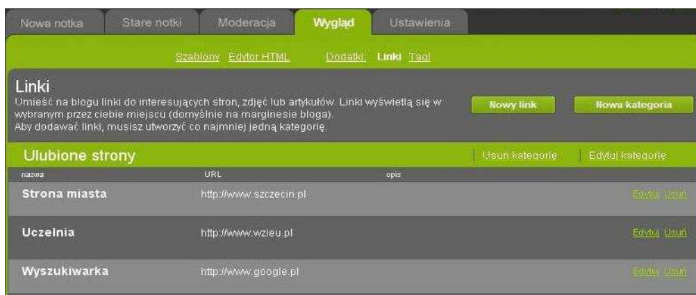
Rysunek 10. Dodawanie Linku.

Dodatkami w serwisie blog.pl są linki oraz Tagi notatek. Linki są to odnośniki do stron, które autor bloga poleca czytelnikom. Tworzenie linku przebiega poprzez wciśnięcie przycisku nowy link, podanie nazwy linku (nazwa, jaka będzie wyświetlana na blogu), adres strony www (adres, na który zostanie przekierowany czytelnik po kliknięciu na link). Linki widoczne są na marginesie blogu (domyślnie) użytkownik może dowolnie wybrać miejsce ich prezentacji.